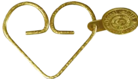
#JRB2 DEHART RINGS BRASS Size W60mm H50mm