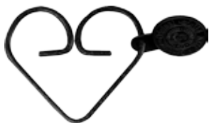
#JRBK2 DEHART RINGS BLACK Size W60mm×H50mm