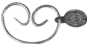
#JRC1 JEAN RINGS CHROME Size W60mm H42mm