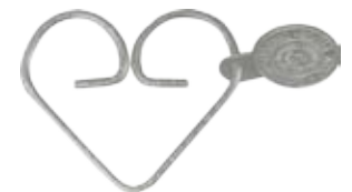
#JRSV2 DEHART RINGS SILVER Size W60mm×H50mm