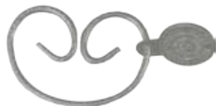
#JRV1 JEAN RINGS SILVER Size W60mm H42mm