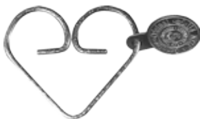
#JRB2 DEHART RINGS CHROME Size W60mm H50mm