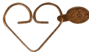
#JRCP2 DEHART RINGS COPPER Size W60mm×H50mm