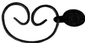
#JRBK1 JEAN RINGS BLACK Size W60mm H42mm