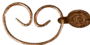
#JRCP1 JEAN RINGS COPPER Size W60mm H42mm