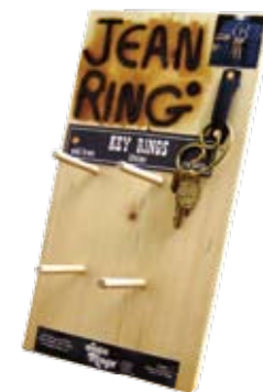
#JRRACK JEAN RINGS DISPLAY RACK Size W182mm H334mm D180mm