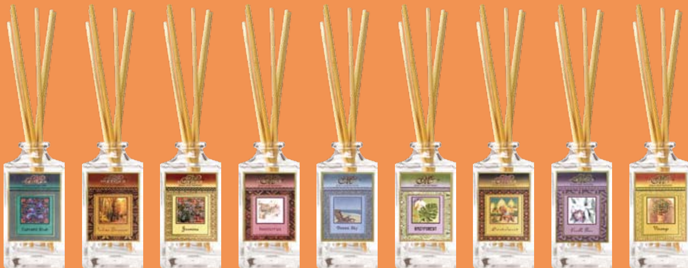
#BCRD CB Currant Blue