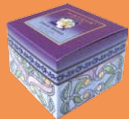
#BCC3LR Lavender Rosemary