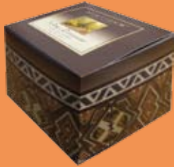
#BCC3IS Indian Summer