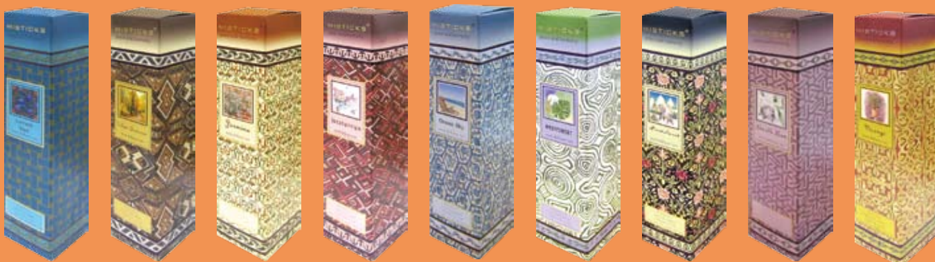
#BCRD VO Vorange